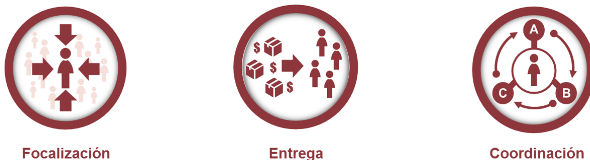
Figura 3: Tipología de la preparación de los sistemas para una protección social reactiva frente a emergencias