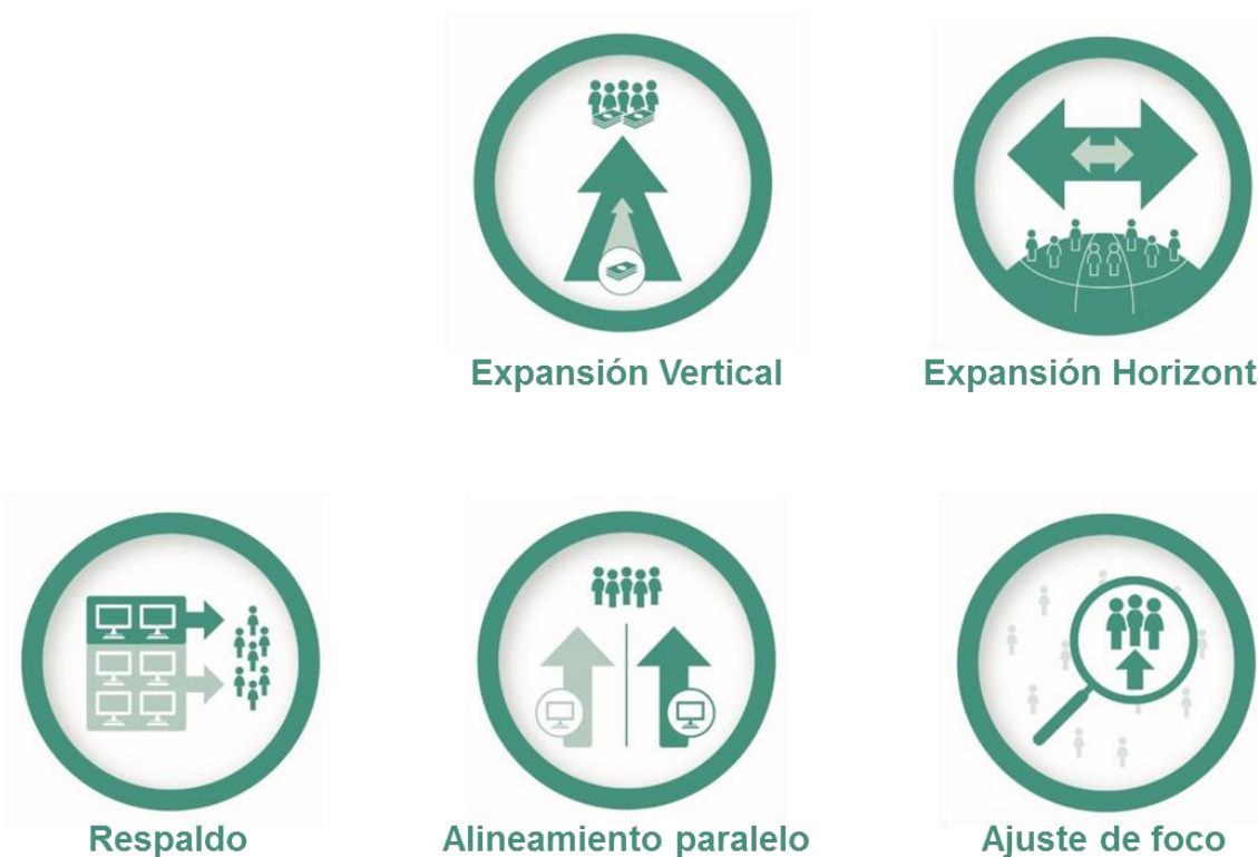
Figura 4: Tipología de la protección social reactiva a emergencias