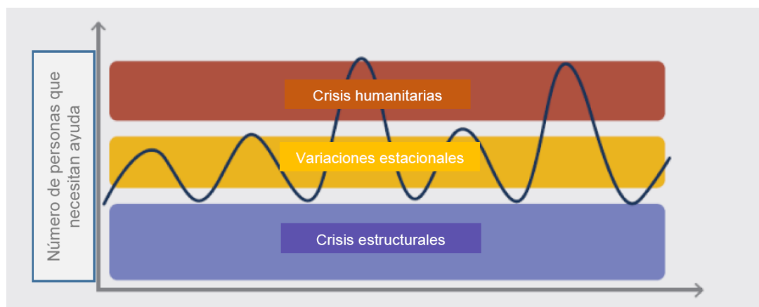
Figura 1: Fluctuaciones en la necesidad de protección social

Por último, con el fin de simplificar el uso del lenguaje y basarnos en los términos que se suelen utilizar en ALC, vamos a usar la palabra “ emergencias ” en lugar de “ crisis humanitarias ” para referirnos a aquellos choques extraordinarios que representan una amenaza crítica a la seguridad alimentaria y nutricional, la salud, la seguridad y el bienestar de las personas. El término “emergencias” suele estar relacionado con intervenciones dirigidas por el gobierno, mientras que la expresión “crisis humanitarias” está asociada a la ayuda externa y, dado que las respuestas en la región son financiadas y dirigidas en gran parte por el gobierno, el primer concepto parece más apropiado.